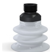
Referência da variação: 96 35SLT 14D-2-F