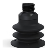
Referência da variação: 96 35NI 14D-2-F