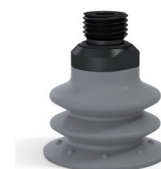
Referência da variação: 96 35NR 14D-2-F