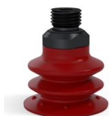
Referência da variação: 96 35SL 14D-2-F