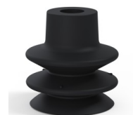
Riferimento variante: 80A 27NI A