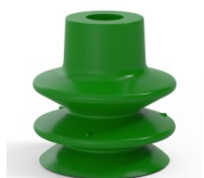
Riferimento variante: 80A 27SLV A