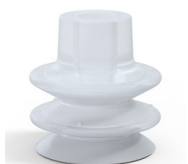
Riferimento variante: 80A 27SLT A