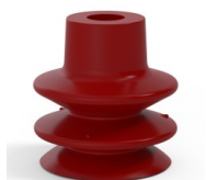
Riferimento variante: 80A 27SL A SH40