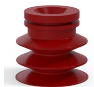
Riferimento variante: 8SC 30-2SL A