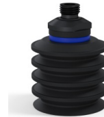
Référence déclinaison : 92 50NI 14D-2