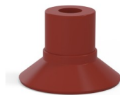
Référence déclinaison : 9 16SL A