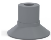
Référence déclinaison : 9 16NR A