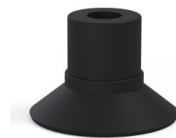
Référence déclinaison : 9 16NI A