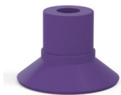
Référence déclinaison : 9 16MNT A