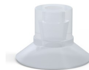
Référence déclinaison : 9 16SLT A