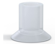
Référence déclinaison : 73A 20SLT A