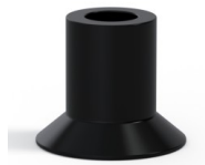
Référence déclinaison : 73A 20PARA A