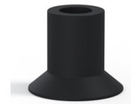
Référence déclinaison : 73A 20NI A