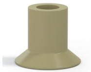
Référence déclinaison : 73A 20CN A