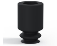
Référence déclinaison : 1 05NI A