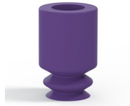
Référence déclinaison : 1 05MNT A