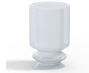
Référence déclinaison : 1 05SLT A