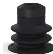
Referencia de la variante: 96 25NI FM5