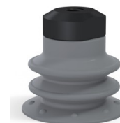
Referencia de la variante: 96 25NR FM5