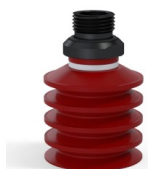
Referencia de la variante: 92 40SL 38D-2