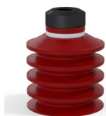
Referencia de la variante: 92 40SL 18D-2-GIC