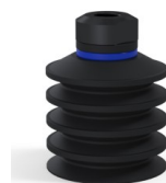
Referencia de la variante: 92 40NI 18D-2-GIC