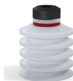
Referencia de la variante: 92 40SLT 18D-2-GIC