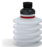
Referencia de la variante: 92 40SLT 14D-2-GIC