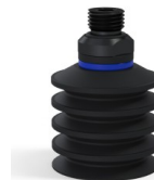
Referencia de la variante: 92 40NI 14D-2-GIC