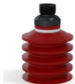
Referencia de la variante: 92 40SL 14D-2-GIC