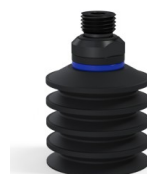
Referencia de la variante: 92 40NI 14D-2