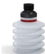
Referencia de la variante: 92 40SLT 14D-2