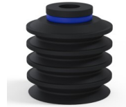
Referencia de la variante: 92 50NI A