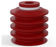
Referencia de la variante: 92 50SL A