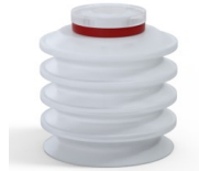
Referencia de la variante: 92 50SLT A