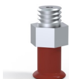
Referencia de la variante: 9 07SL M5M