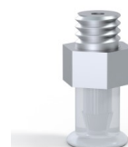
Referencia de la variante: 9 07SLT M5M