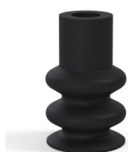
Referencia de la variante: 8B 30NI A • Color: Negro • Materiales: Nitrilo