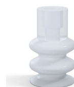
Referencia de la variante: 8B 30SLT A • Color: Translúcido • Materiales: Silicona