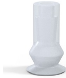
Referencia de la variante: 8 08SLT A