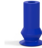
Referencia de la variante: 8 08PU A