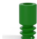
Referencia de la variante: 8 05SLV A