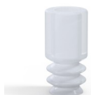
Referencia de la variante: 8 05SLT A