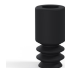
Referencia de la variante: 8 05NI A