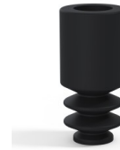
Referencia de la variante: 8 04NI A