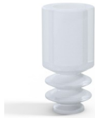
Referencia de la variante: 8 04SLT A