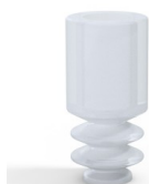
Referencia de la variante: 8 04SLT A