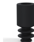
Referencia de la variante: 8 04NI A