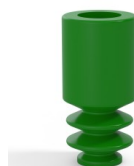
Referencia de la variante: 8 04SLV A