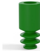
Referencia de la variante: 8 04SLV A