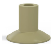
Referencia de la variante: 7 26CN A