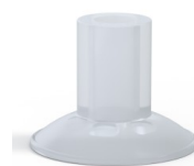
Referencia de la variante: 7 26SLT A