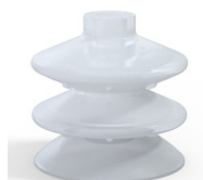
Referencia de la variante: