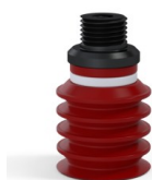
Referencia de la variante: 92 20SL M18D