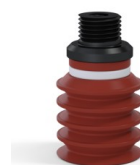
Referencia de la variante: 92 20SLBRIQUE 18D