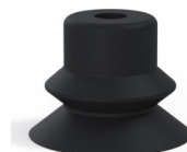
Referencia de la variante: 81SB 30NI A