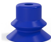
Referencia de la variante: 81SB 30PU A