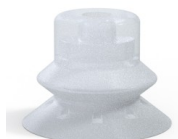
Referencia de la variante: 81SB 30SLT A