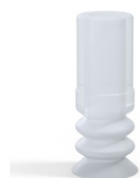
Referencia de la variante: 8M 12SLT A