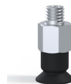
Referencia de la variante: