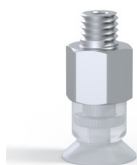
Referencia de la variante: