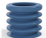
Referencia de la variante: 8K 45SLBLEU A SH30