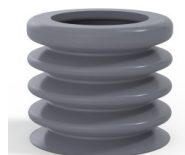
Referencia de la variante: 8K 45SLDG A